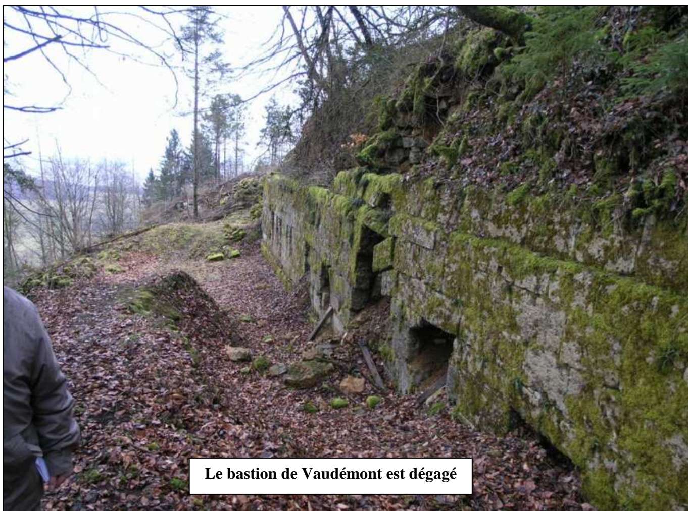
Le bastion de Vaudémont est dégagé