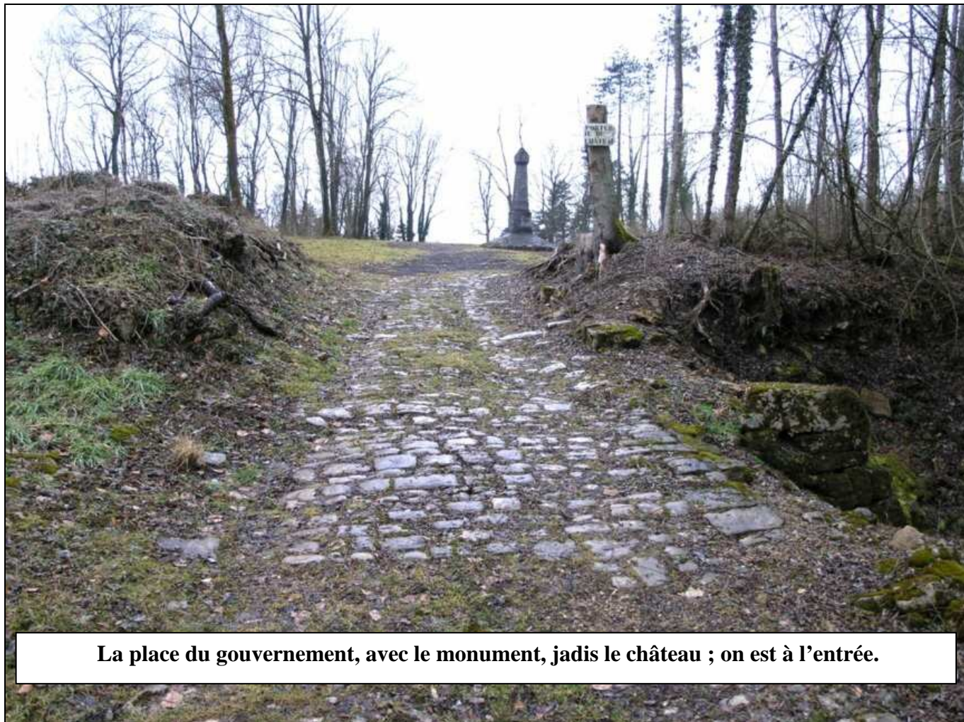
La place du gouvernement, avec le monument, jadis le château ; on est à l'entrée.