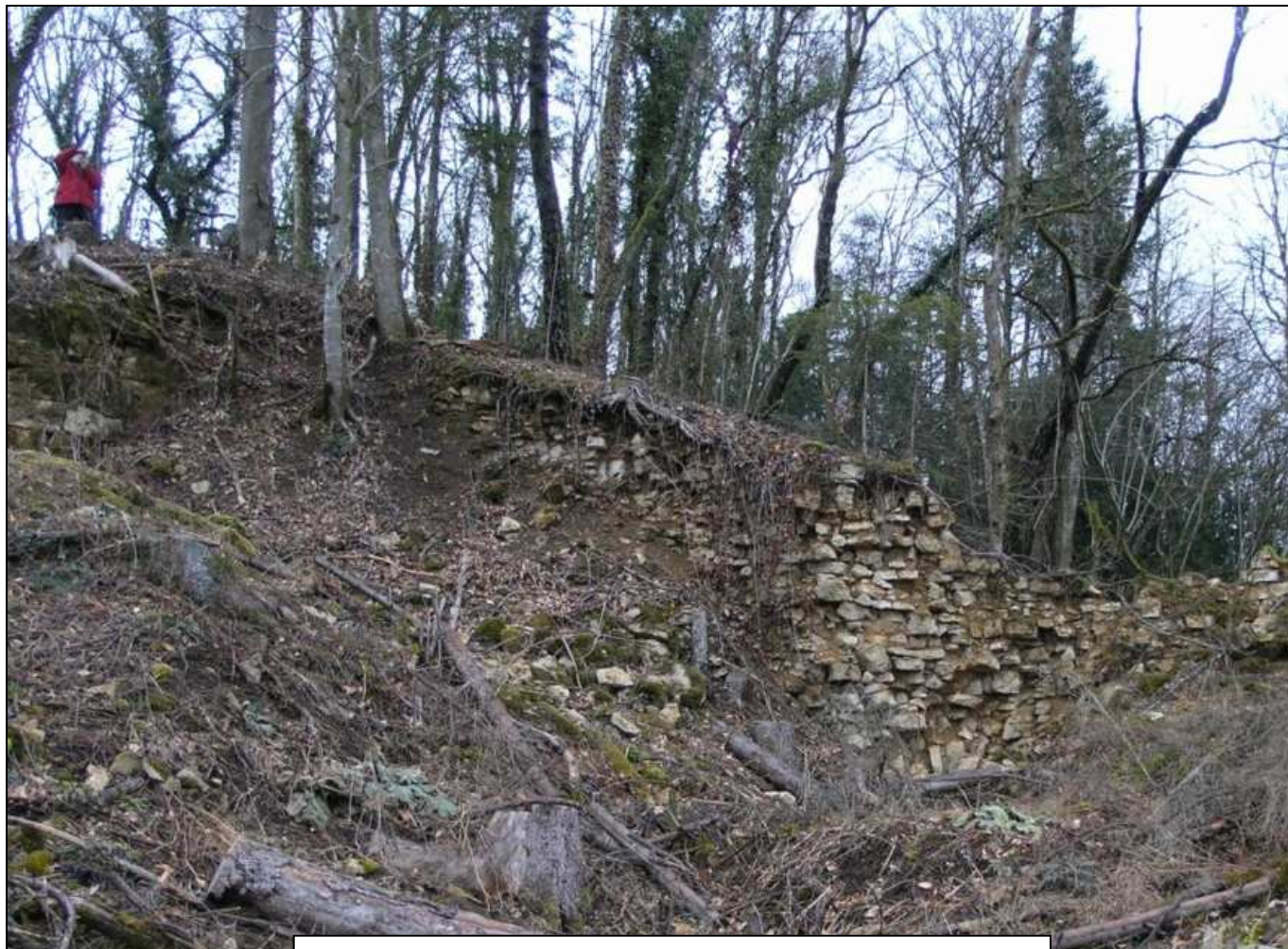
Des murs s'écroulent, découvrant des souterrains