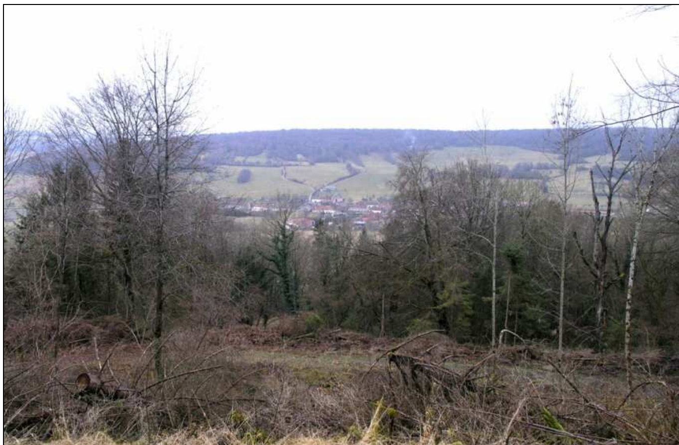
On aperçoit Outremécourt, gros plan sur son église bâtie avec les pierres de la Collégiales